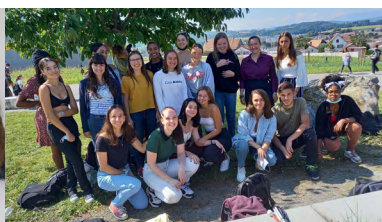
Record du nombre de personnes présentes à la rentrée en 2021