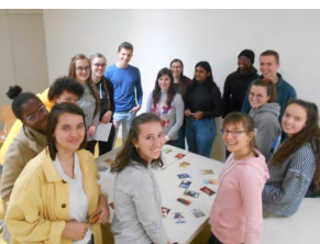
Photo prise par Joëlle Emery, ancienne coordinatrice, lors de sa visite en novembre 2019