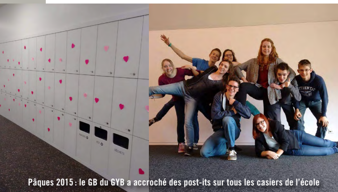
Pâques 2015 : le GB du GYB a accroché des post-its sur tous les casiers de l'école