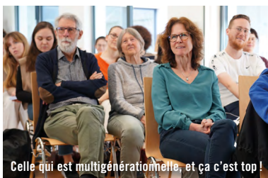
Celle qui est multigénérationnelle, et ça c'est top !