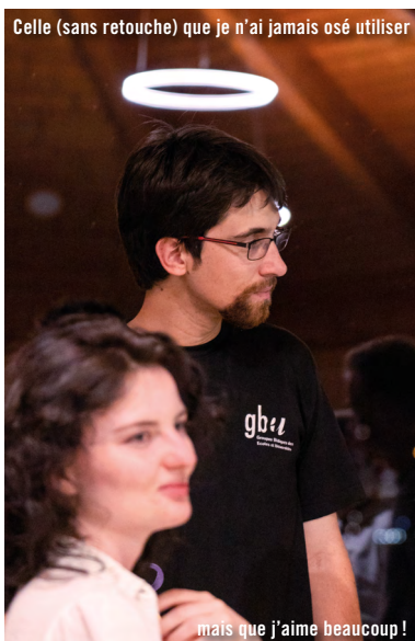
Celle (sans retouche) que je n'ai jamais osé utiliser