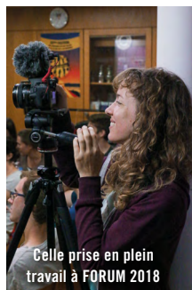
Celle prise en plein travail à FORUM 2018