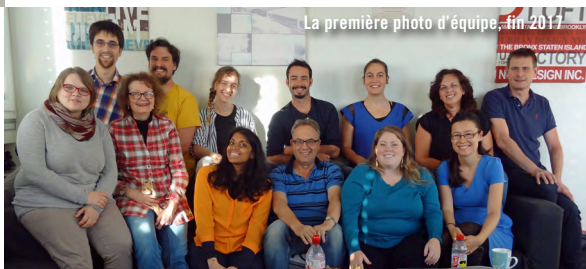
La première photo d'équipe, fin 2017